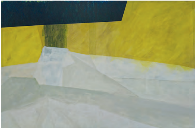
JackegelbPapier, 2018 90 x 120 cm, Acryl auf Papier (201803-03_JackegelbPapier_kl.jpg)