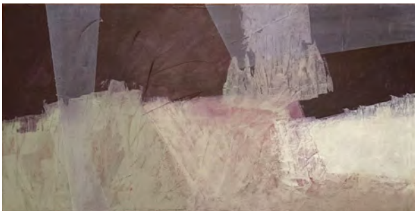
o.T., 2018 40 x 80 cm, Acryl auf Leinwand (oT_2018-10.jpg)